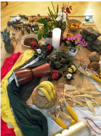
Weltgebetstag am 6. März 2020