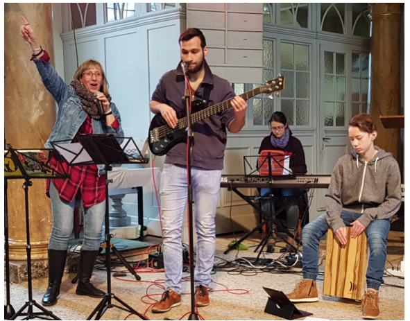
Lobpreisgottesdienst mit den VOMI Fresh Maker am 8. März 2020