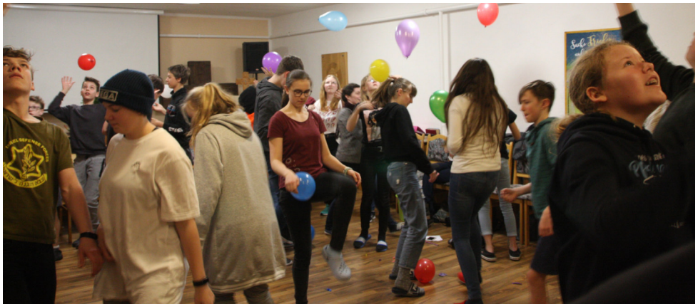
Impressionen von der Konfirüstzeit