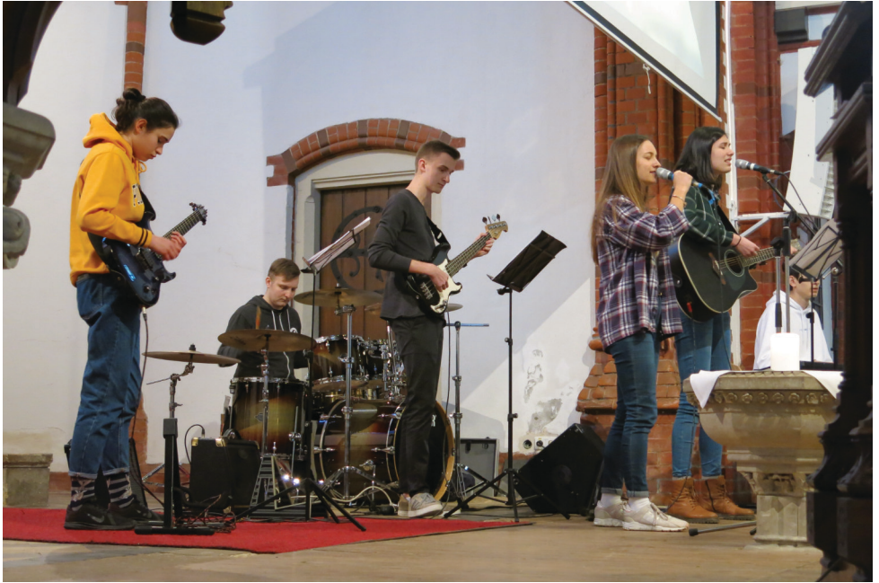
Lobpreis im halbfünf-Gottesdienst am 1. März 2020