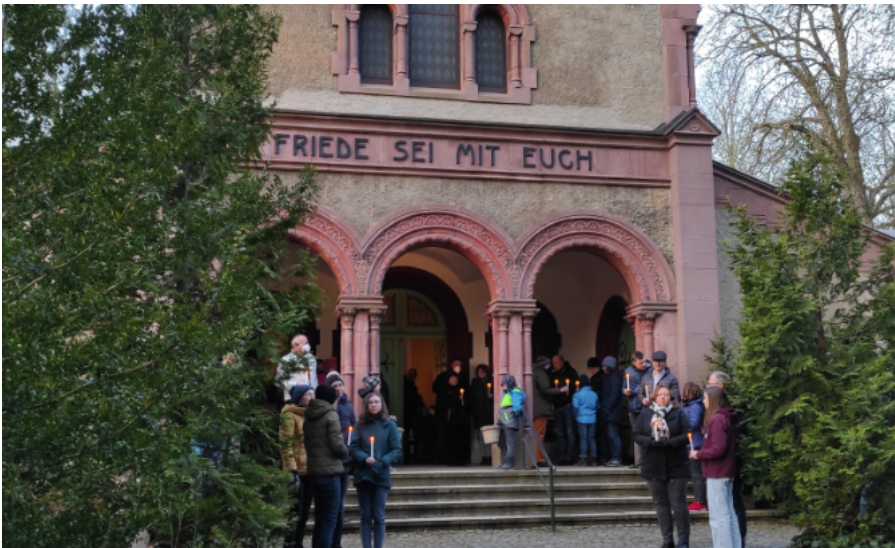
Auferstehungsandacht am Ostersonntag 2022