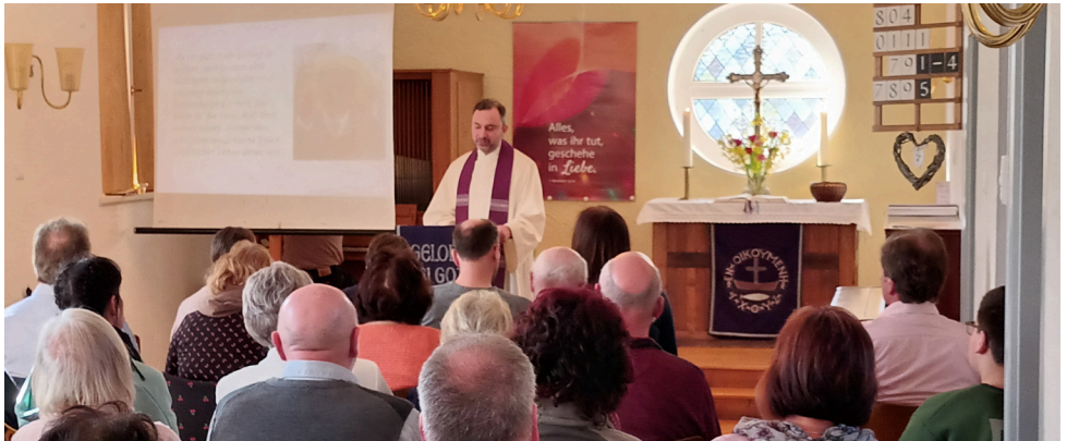
Gottesdienst in der Kapelle Stelzendorf am 03.03.2024